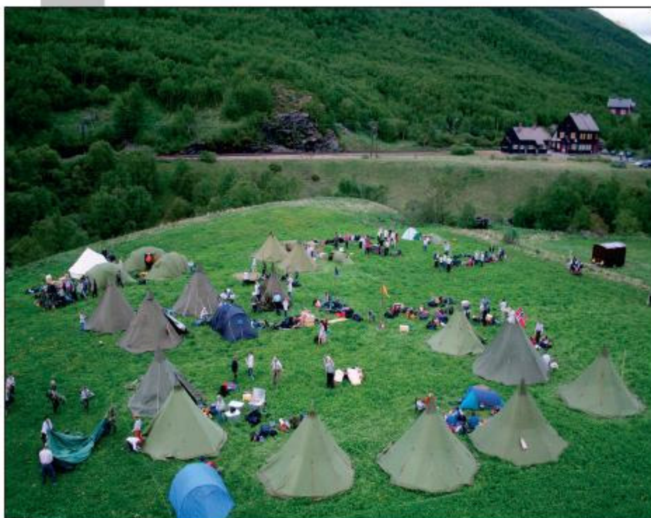
Leiren bygget opp